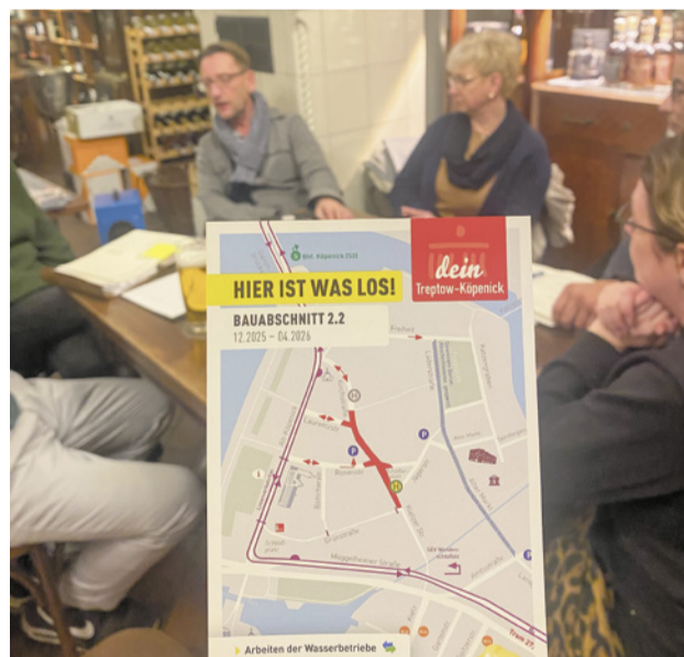
Stammtisch der Gewerbetreibenden in der Altstadt Köpenick

Ein Schwerpunkt ist die Baustellenkommunikation: Bauphasen, Sperrungen, Umleitungen und mögliche Risiken (z.B. archäologische Be-