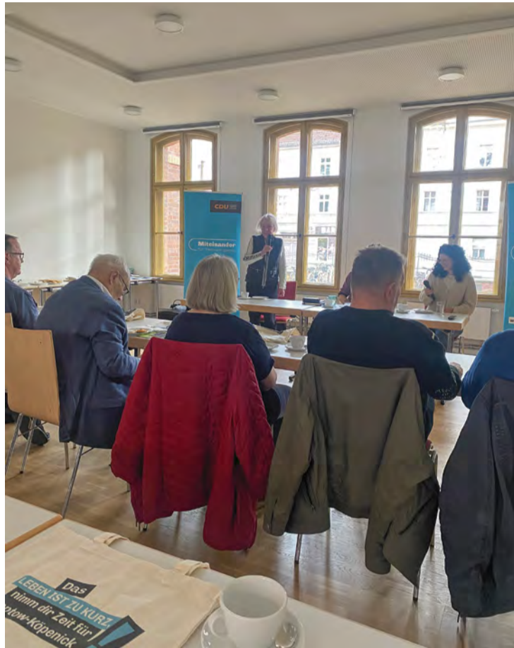
Seniorenforum in der Alten Schule