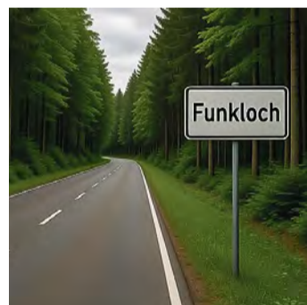
Funkloch im Wald

tivisch könnten ergänzende Hinweise, etwa aus der Funkloch-App, helfen, lokale Bedarfe noch genauer abzubilden.