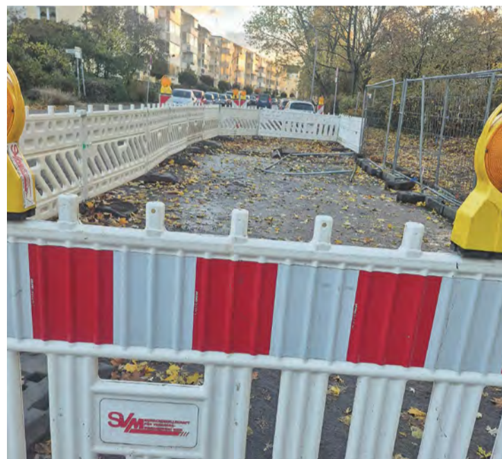
Tote Baustelle in der Grünen Trift