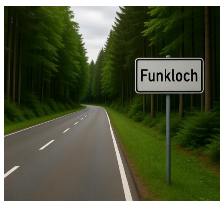
Keine Verbindung im Wald

Sattelkau macht Druck: Sein Team hat bereits alle großen Anbieter kon-