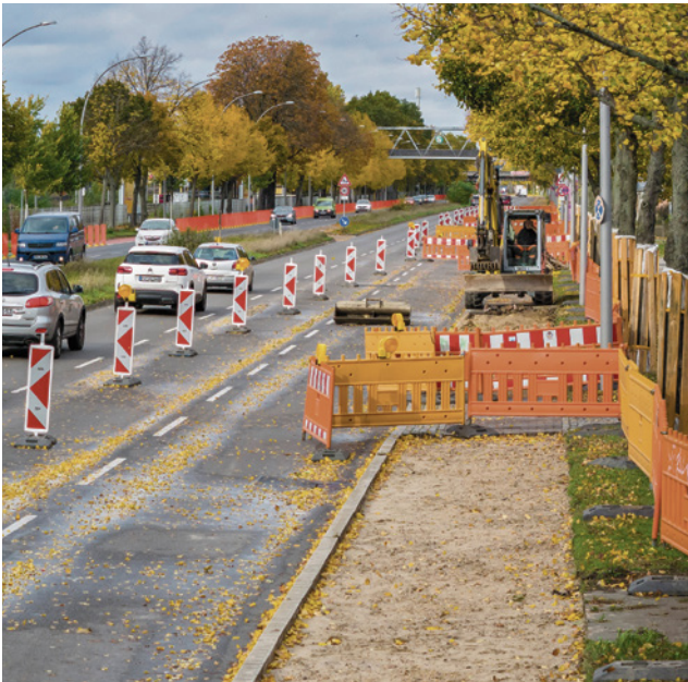
Straßenbaustellen werden jetzt besser koordiniert