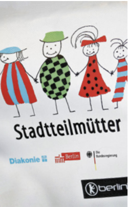
Werbung der Stadtteilmütter

Die 240 Stadtteilmütter haben nicht nur bewiesen, dass sie in der Lage sind, positive Veränderungen in verschiedenen Ortsteilen und konkreten Familien herbeizuführen, sondern sie haben auch viele Frauen dazu inspiriert, sich aktiv ehrenamtlich für die Gemeinschaft und Nachbarschaft einzubringen oder sogar selbst zu Stadtteilmüttern zu werden. Dies hat zu einer nachhaltigen Stärkung des Selbstbewusstseins und der beruflichen Ambitionen vieler Frauen in Berlin geführt.