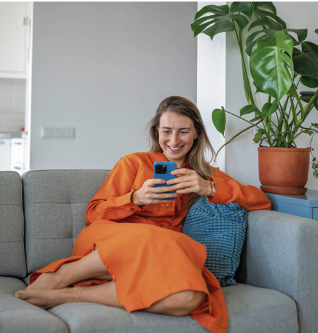
Ummelden von zu Hause statt lange Behördengänge

Digital von zu Hause Behördengänge erledigen: Das