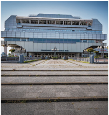
Zukunftsprojekt: ICC

Wie geht es weiter mit dem ICC Berlin? Antworten darauf soll ein internationaler Wettbewerb geben, der jetzt auf den Weg gebracht wurde. Dabei sollen weltweit die besten und tragfähigsten Konzepte gesucht werden – für einen Ort der Kunst, Kultur, Kreativwirtschaft, Innovation und Kongresse. Die Zeit ohne Nutzung soll endlich aufhören.