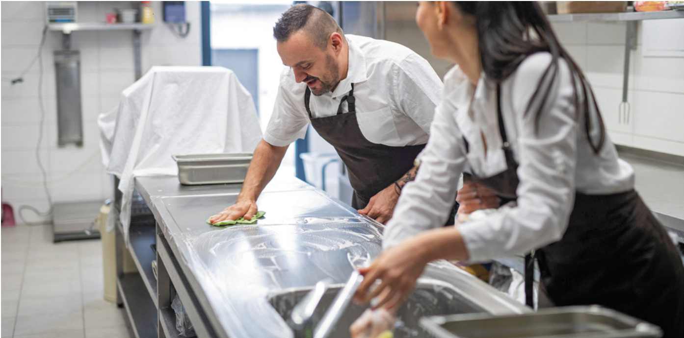
Sauberkeit ist Trumpf, Erleichterungen bei der Infektionsschutzbelehrung für Mitarbeiter

Der Senat geht auf Initiative der CDU-Fraktion mit hohen Bußgeldern gegen gewissenlosen Konsum vor: Wer in Gegenwart von Minderjährigen raucht, muss zwischen 300 bis 1000 Euro zahlen. Wer mit mehr als der erlaubten Höchstmenge von 25 Gramm erwischt wird, muss mit 250 bis 1000 Euro Bußgeld rechnen. Und wer Cannabis anbauen für einen unerlaubten Anbau von außerhalb der EU einführt, dem drohen 100 bis 30.000 Euro Strafe.