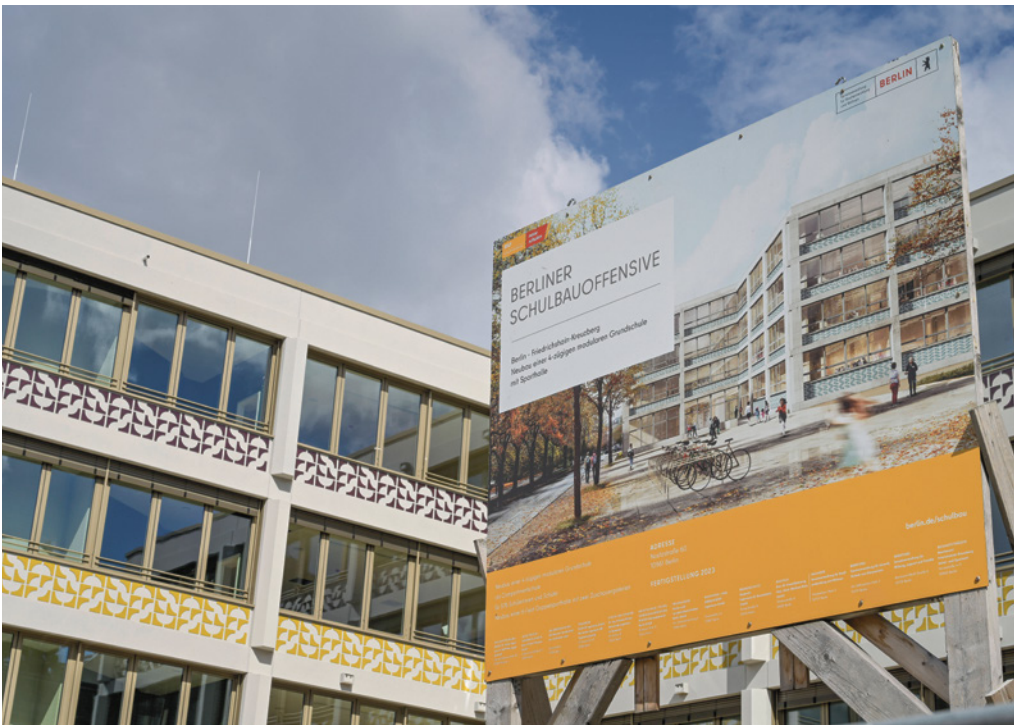
Das Bauschild verdeutlicht: Beim Schulbau geht es voran

Neues Gymnasium in Marzahn Diese Bilanz geht aus dem Bericht zum Schuljahr 2023/24 von CDU-Bildungssenatorin Katharina Günther-Wünsch hervor (Titel: „Maßnahmen- und Finanzcontrolling zum Schulbauprogramm“). Auch der Ausblick für das neue Jahr ist vielversprechend.