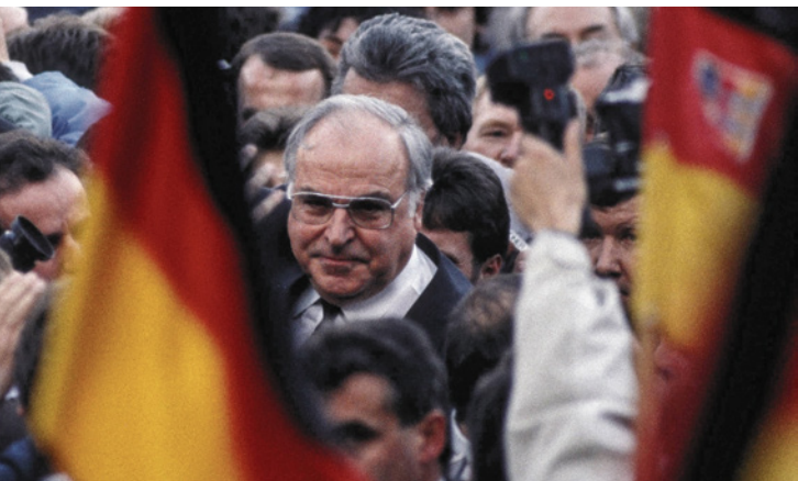
Dr. Helmut Kohl: Kanzler der Einheit und Ehrenbürger Berlins

Ort jedoch offengelassen. Nun wird diese Initiative von Berlins Regierendem Bürgermeister Kai Wegner (CDU) aufgenommen. Er kündigte Gespräche mit dem Bezirk Mitte an, um einen angemessenen Standort zu finden. Suche im Regierungsbezirk Mitte „Sicherlich ist der Bezirk Mitte mit Bundestag und Bundeskanzleramt prädestiniert, hier an den Kanzler der Einheit zu erinnern,“ so Wegner. „Ich werde dazu Gespräche mit dem Bezirk führen, denn wir wollen Helmut Kohl im Berliner Stadtbild würdigen.“