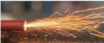
Funkenflug, brandgefährlich

Die Polizei wird auch in diesem Jahr zu Silvester in Teilen der Stadt wieder Böllerverbotzonen in Berlin einrichten. Zur Vorbereitung wird an bestimmten Brennpunkten wie etwa in der Sonnenallee die Gefahrenlage eingeschätzt. So sollen chaotische Zustände und Angriffe auf die Polizei und Feuerwehr verhindert werden. Parallel dazu gibt es vorbeugende Beratungen an Schulen und Jugendeinrichtungen, um junge Berliner für die Gefahren durch Feuerwerk zu sensibilisieren. Ein generelles Böllerverbot wird es nicht geben.