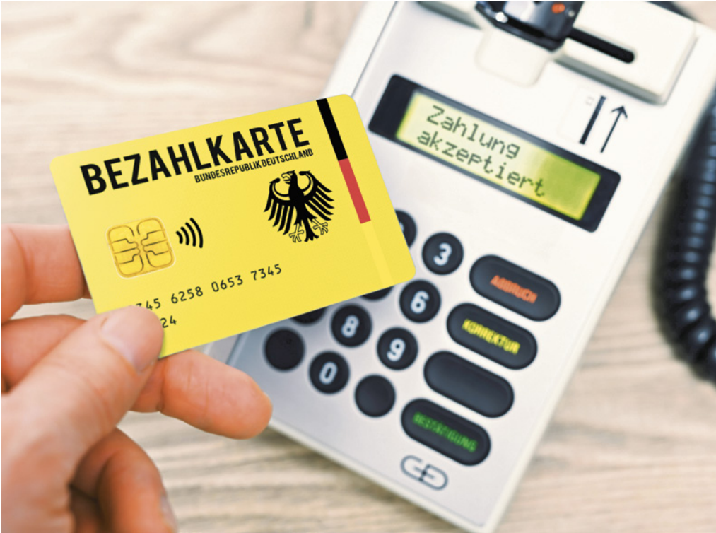
Bezahlkarte für Asylbewerber mit beschränktem Guthaben von 50 Euro

Die Hoffnung auf ein wirtschaftlich besseres Leben ist kein Asylgrund. Die Karte verhindert, dass Asylbewerber mit den Leistungen, die für ihren Lebensunterhalt gedacht sind, ihre Schleuser bezahlen oder Geld ins Heimatland schicken. Mit der Karte wird der Verwaltungsaufwand gesenkt. Anreize für die Migration nach Deutschland ohne Asylgrund werden gesenkt.