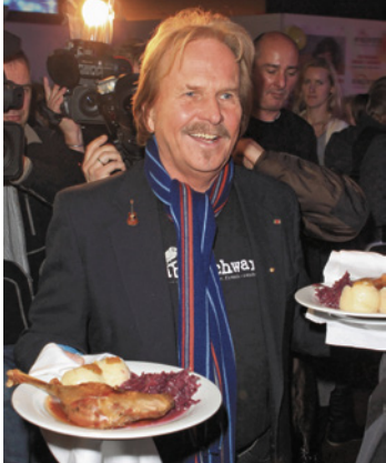
Frank Zander, Berliner Original

Zander und sein Sohn wurden für ihre sozialen Verdienste mit dem Bundesverdienstkreuz ausgezeichnet. Seine neu gegründete Stiftung unterstützt eine Caritas-Tagesstätte, die sich um Drogenabhängige kümmert.