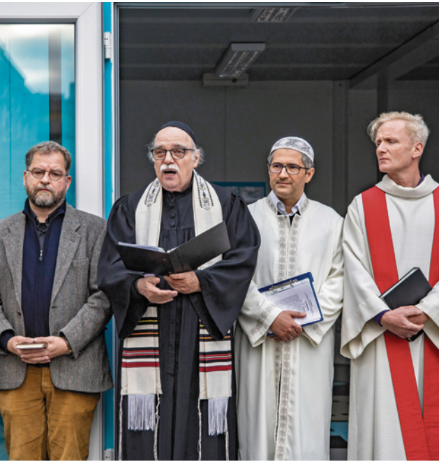
Juden, Christen und Moslems beten gemeinsam im House of One in Berlin

Dabei kommt es darauf an, fest zusammenzuhalten. Bei niemandem darf der Eindruck entstehen, dass das hier nicht mehr unsere Stadt wäre, sondern nur noch Bühne anderer. In Teilen Berlins zweifelt man, ob die Zustände noch