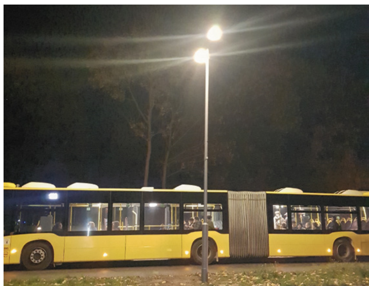
Die neue Straßenlaterne beleuchtet wieder den Müggelheimer Damm

Liebe Nachbarn, dieses Beispiel zeigt: Es lohnt sich, sich für unseren Kiez zu engagieren. Manchmal können Lösungen schneller erreicht werden, als man denkt!