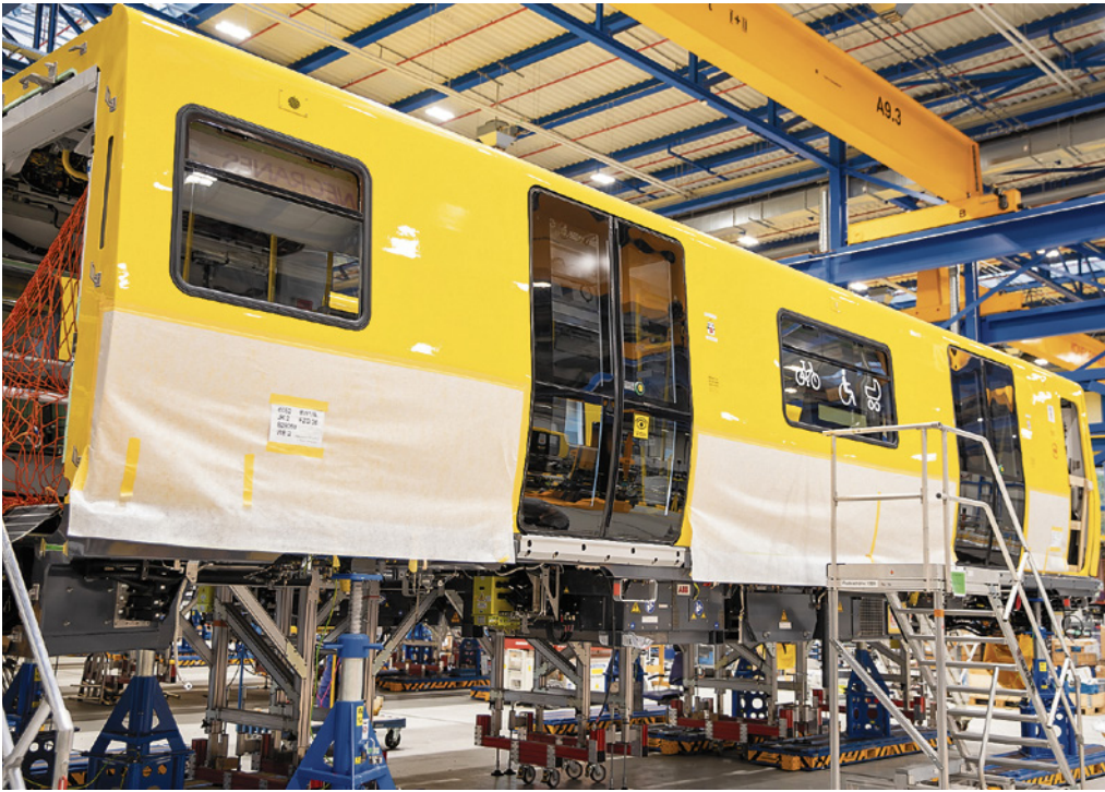
Ein neuer U-Bahnwagen für Berlin in der Fertigung

Bei der U3-Verlängerung zum Mexikoplatz hat der Senat in diesem Jahr die Durchführung der nächsten Planungsschritte beschlossen, der Spatenstich ist in 2025 geplant. Die Kosten-Nutzen-Untersuchung und Wirtschaftlichkeitsberechnung ist ein entscheidender Schritt für den U-Bahn-Bau, diese wichtigen Planungsschritte wurden kürzlich für die U7 bis Flughafen BER und bis Heerstraße Nord beschlossen. Für die U8 bis ins Märkische Viertel kommt als nächster Schritt die Wirtschaftlichkeitsuntersuchung. Auch die Verlängerung der U-Bahnen in den Pankower Norden sind in Planung.