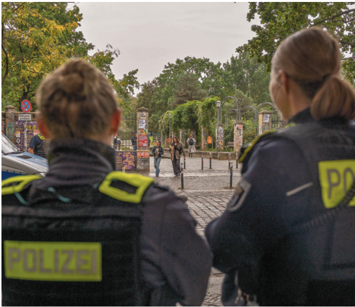
Polizisten sehen Cannabis-Freigabe kritisch

Kritik der Gewerkschaft der Polizei. Mehrheit hält Legalisierung für falsch